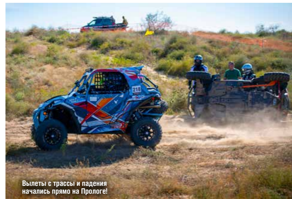
Вылеты с трассы и падения начались прямо на Прологе!