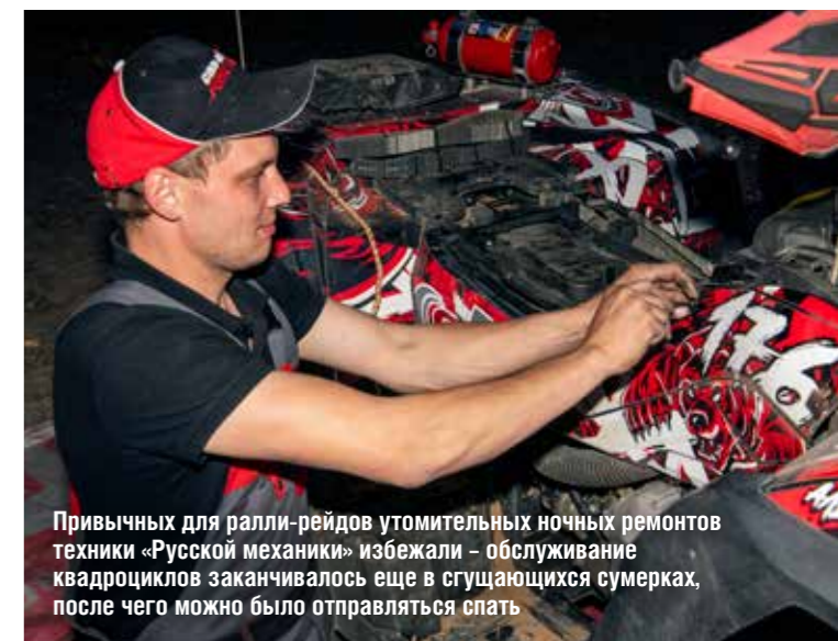
Привычных для ралли-рейдов утомительных ночных ремонтов техники «Русской механики» избежали – обслуживание квадроциклов заканчивалось еще в сгущающихся сумерках, после чего можно было отправляться спать