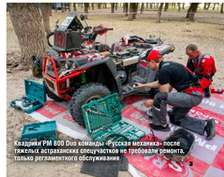
Квадрики PM 800 Duo команды «Русская механика» после тяжелых астраханских спецучастков не требовали ремонта, только регламентного обслуживания