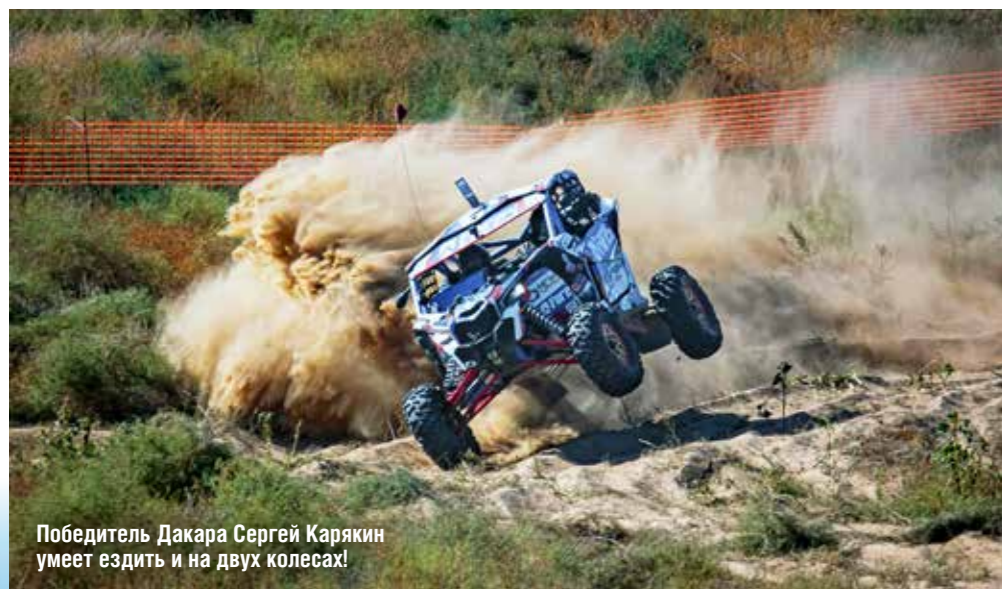
Победитель Дакара Сергей Карякин умеет ездить и на двух колесах!