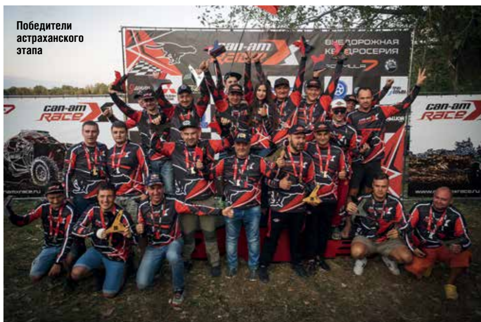
Победители астраханского этапа